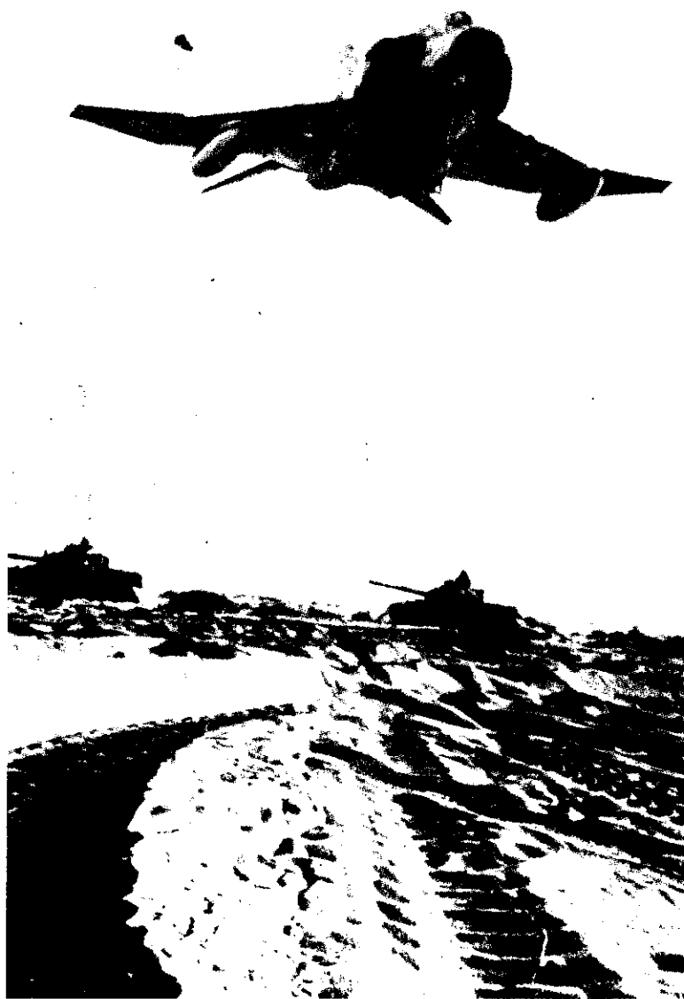
מטוס ישראלים בסיוע לכוחות-קרקע. אוקטובר 1973