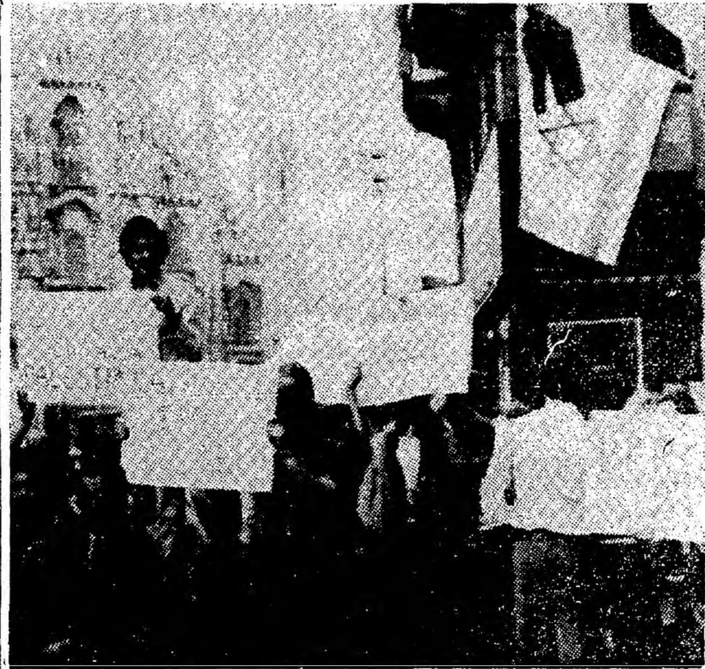
חברי אגודת הסטודנטים הישראלית-האיטלקית הפגינו אתמול בכיכר הדואומו במילאנו בגנות ההתקפה הרצחנית בלוד. דגל ישראל עטוף שחורים.

לממשלת לבנון, אך רוח ה"דברים שמדינות שונות נתיבן בקשו להעביר ללבנון עשויה לשמש כמתן אזהרה אחרונה לבירות.