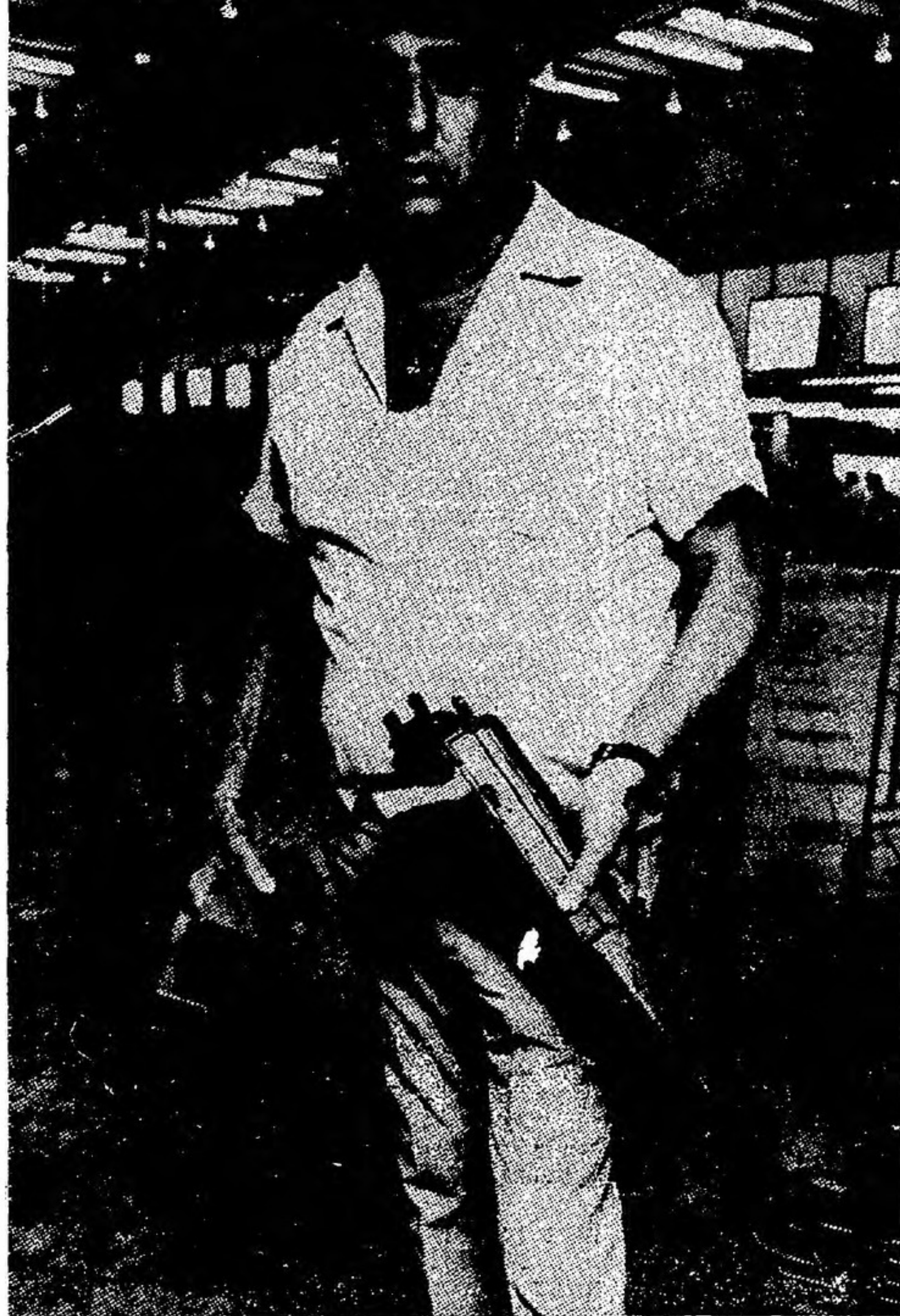
שני רובי הקלאשניקוב שהיו בידי המחבלים

כוי לצאת לחיים מהמשימה אליה נשלחו. אדם בשם ג'ירו שלוש המחבלים היפאניים עלו למטוס "אייר פראנס", כעת חניית הביניים שלו ב"רומא. הנשק נמסר להם על ידי אדם בשם ג'ירו, ממנהיגי ארגון הסטודנטים היפאני ה"שמאלי", הצבא האדום "שלו-שת היפאנים פעלו בשליחות החזית העממית לשחרור פלשתיין", ולפי אחת הגרסאות לא היו שכירי-חרב, אלא פעלו בשם אידיאולוגיה. כלי הנשק שנמצאו במוי וודותיהם היו רובי "קאלאשני-ניקוב" מסוג חדש, שלא מוכר עד כה בישראל, בעל קת מתכת מתקפלת. ברשותם היו מחסניות מפלסטיק ובכל אחת מהן יותר מ-20 כדורים. כל שתי מחסניות היו מחוברות יחד באמצעות רצועות פלסטיק, שניתן להתליפן במהירות. רות היפאנים רוקנו את כל הכדורים שהיו במחסניות כלי הנשק האוטומטיים. הועלתה גם הנחה, שהמחב-לים ירו גם מאקדחים בעלי קוטר זעיר. ברשות כל מחבל היו גם שני רימונים, וארבעה מהם הושלכו בבית הנתיבות. אחד מהם התפוצץ ביציאה, כתוצאה מכך נהרג אחד ה"יפאנים. האחר הושלך לעבר מטוס של חברת "ס.א.ס." ש"חגה במסלול התעופה.