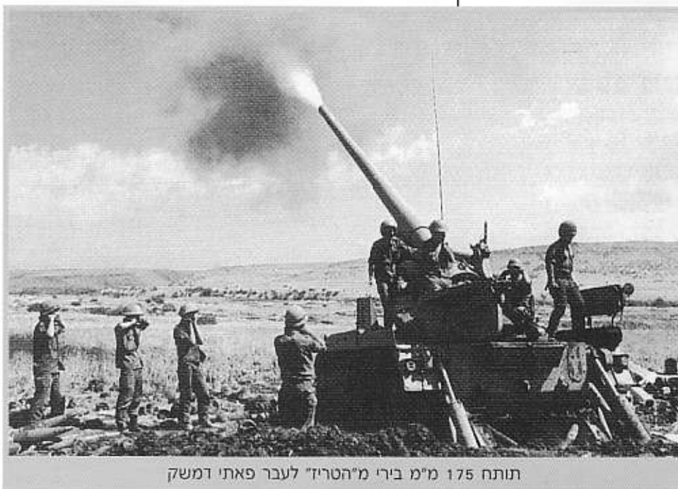
תותח 175 מ"מ בירי מ"הטרויז" לעבר פאתי דמשק

בליל 21-22 באוקטובר פתח פיקוד הצפון במבצע "קינח" לכיבוש החרמון. זה היה המבצע המוטס הגדול ביותר בתולדות צה"ל מאז מלחמת העצמאות. חיל האוויר ריכז מאמץ עיקרי במבצע זה והשתתפו בו כל המערכים: מטוסי סיור וצילום להשגת מודיעין עדכני על היערכות האויב ועוצמתו; מטוסי יירוט להבטחת שמים נקיים;