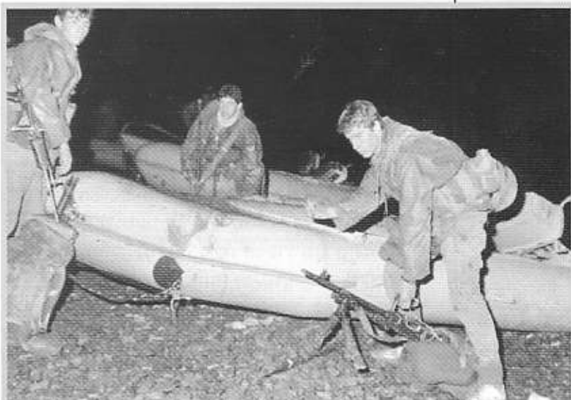
לוחמים עולים על סירת גומי לקראת צליחת התעלה

האגף הצפוני של מסדרון התנועה הישראלי אובטח היטב ביום זה ובשעות אחר הצהריים הושלם הגשר