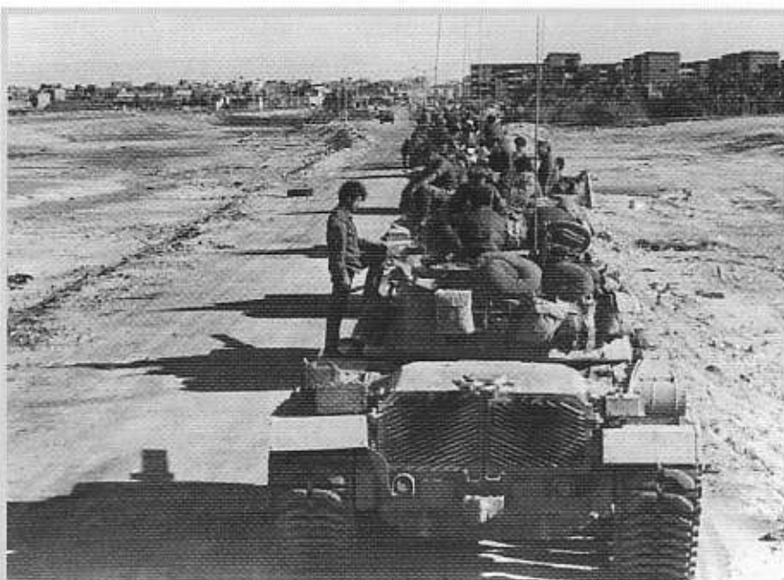
טור שריון של צה"ל נערך לקראת כניסה לעיר סואץ

ישראל נדרשה להפסיק את הלחימה ב-22 באוקטובר. קיסינג'ר הבין ששכנוע ישראל להסכים להחלטה זו בזמן התפתחות מוצלחת של המתקפה ממערב לתעלה מצריכה מאמץ מיוחד ועל כן טס מיד לישראל ממוסקבה עוד לפני חזרתו לארצות-הברית. לאחר שכנועיו והפצרותיו הסכימה ישראל; נשיא מצרים סאדאת המשיך לשחק את המשחק עד לרגע האחרון, אולם בדקה ה-90 הסכים להחלטה (שהוא היה מיוזמיה מלכתחילה על מנת להינצל מתבוסה); אולם סוריה שלא שותפה במהלכים המצריים-סובייטיים לשביעות רצונה לא הסכימה להיענות להחלטת מועצת הביטחון.