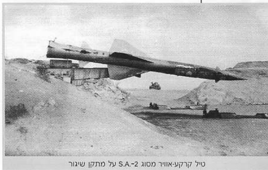
טיל קרקע-אוויר מסוג S.A.-2 על מתקן שיגור

בזירת סיני ניסו המצרים לפתח את מתקפתם מזרחה, אולם לא הצליחו להתקדם מעבר ל"כביש החת"ם" בשום גזרה. ב-9 באוקטובר תקפה אוגדה 143 בנסותה לשפר עמדות, אולם בהצלחה שלא עלתה על הצלחתה של אוגדה 162 ביום הקודם ובאבדה 50 טנקים. המצרים ניסו לפתח את מתקפתם גם דרומה לאורך החוף המזרחי של מפרץ סואץ אל עבר ראס סודר, אולם איבדו מסוקים וכוחות קומנדו רבים בניסיון זה, והתקדמותם הקרקעית נבלמה אף היא בקלות יחסית.