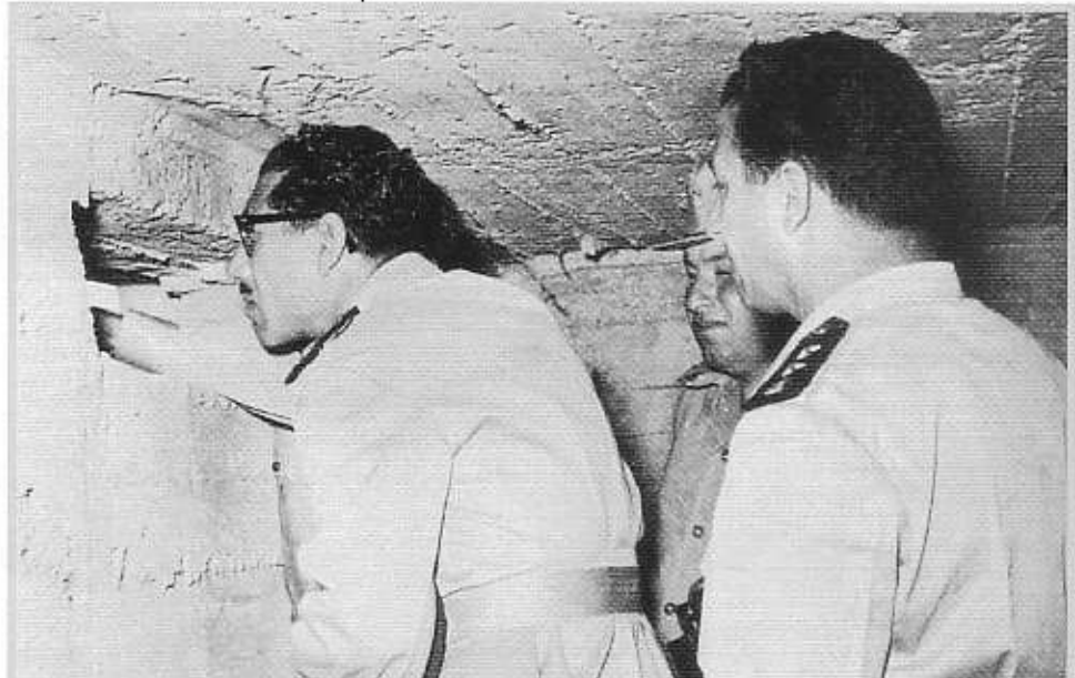
המפקד העליון של צבא מצרים, הנשיא סאדאת (צופה) עם הרמטכ"ל שאזלי (ממין) ושר המלחמה כמאל חסן עלי בעת ביקורם בבונקר בקו הביצורים המצריים בתעלה

יתרון מכריע הן ביחסי עוצמה מול צה"ל הן במרחב כבוש, עד שצה"ל לא יוכל להשמיט מידם הישגים אלו אחרי שיכריע את הסורים וירכז את כוחותיו בדרום. בבוקר 14 באוקטובר פתחו המצרים במתקפה, במקביל לאורך החזית כולה. החטיבות המצריות התוקפות שיצאו באופן זמני מ"מטריית" הטק"א נהפכו ל"טרף" קל יחסית לתקיפות חיל האוויר ונתקלו בכוחות צה"ל שהיו ערוכים מראש בעמדות שולטות. המתקפה המצרית נבלמה בכל הגזרות בספגה אבדות רבות. ביום זה אבדו למצרים למעלה מ-250 טנקים ואילו אבדות צה"ל היו מזעריות ביותר. לראשונה מאז פרצה המלחמה הטו תוצאות הלחימה ביום זה את הכף של מאזן העוצמה לטובת צה"ל, ונוצרו התנאים לצליחת התעלה ומעבר למתקפה.