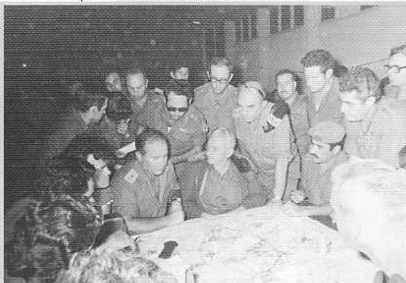
רא"ל (מיל) חיים בר-לב במטה פיקוד צפון עם אלוף הפיקוד יצחק חופי

ב-14 באוקטובר עצרו כוחות פיקוד הצפון התוקפים את הזירה הסורית כ-40 ק"מ מדמשק. עייפות הלוחמים מלחימה אינטנסיבית למעלה משבוע וההיתקלות בחילות המשלוח העיראקי והירדני אחרי 12 בחודש, שכוונו לסתימת הפרצה שנוצרה בחזית הסורית, גרמו לבלימת התקדמות צה"ל. בשלב זה של המלחמה נהפכה מעורבות ברית-המועצות וארצות-הברית לגורם משפיע הן בהספקת אמצעי לחימה וציוד הן בניסיונות להביא לידי הפסקת אש.