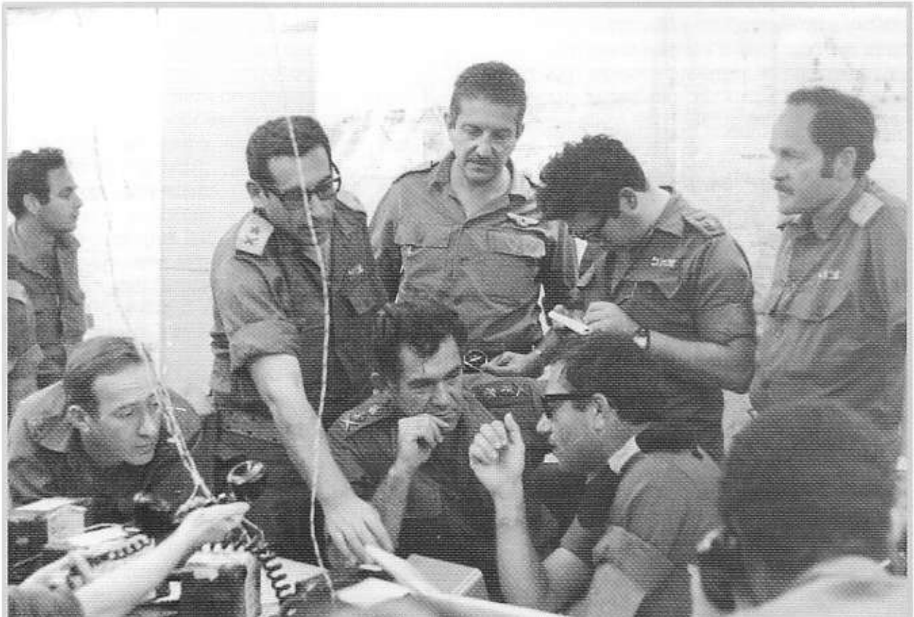
הרמטכ"ל ופמלייתו במטה פיקוד דרום עם אלוף הפיקוד שמואל גונן (גורדיש). עומדים מאחורי הרמטכ"ל האלופים עזר ויצמן ורחבעם זאבי

ב-24 באוקטובר פעלה אוגדה 162 לשיפור עמדות ממערב לתעלה. בפעילות זו החליטה להשתלט על העיר סואץ בהעריכה שההתנגדות בעיר תהיה חלשה ביותר. עם שחר חדרו כמה שדרות שריון לעיר כדי להשתלט עליה בסערה, אולם נתקלו בהתנגדות עקשנית ובלתי צפויה. התרחשות זו נמשכה לתוך יממה של לחימה קשה בשטח עירוני בלתי מוכר וקרבת היתקלות