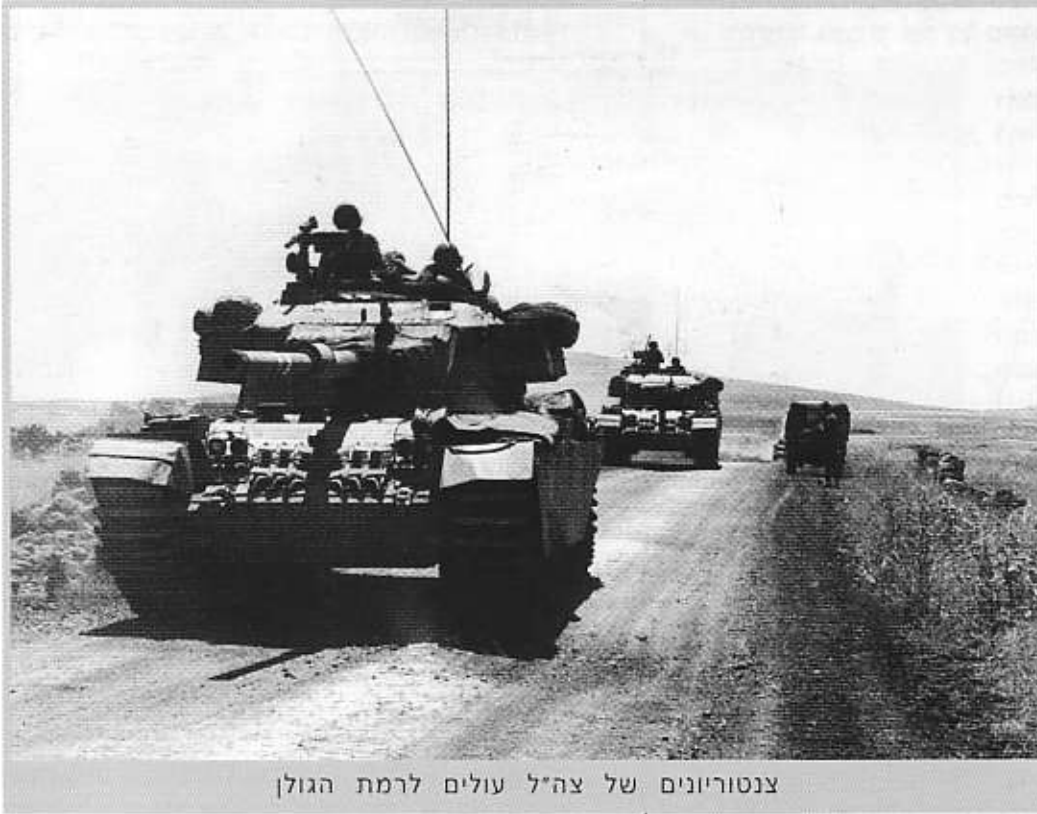
צנטוריונים של צה"ל עולים לרמת הגולן

הפסקת אש והקפאת המצב. לאסטרטגיה ישראלית זו קדמו דיונים ארוכים ביממה שקדמה לכך בפורומים השונים של הפיקוד העליון. הרמטכ"ל שאף לכפות הפסקת אש על ידי מעבר מידי למתקפה בזירה המצרית שתיעשה בצליחת התעלה והעברת המלחמה לשטח האויב. מפקד החזית רב-אלוף חיים בר-לב ומפקד חיל האוויר צדדו אף הם בכך, ואילו סגן הרמטכ"ל האלוף ישראל טל העדיף לשחוק את השריון המצרי ממזרח לתעלה. ראש הממשלה לא רוותה נחת מהניסיון לכרוך נושא מדיני וצבאי (הפסקת אש וצליחת התעלה) בשיקולי הרמטכ"ל. היא ושרי הקבינט ניסו להבין מדוע לא ניתן להפריד בין שתי הסוגיות ולא