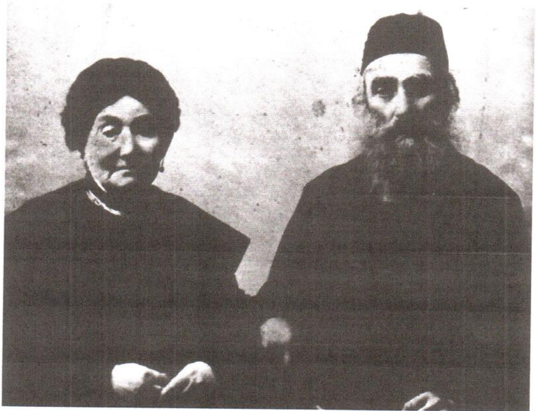
הזוג בשנותיהם המאוחרות