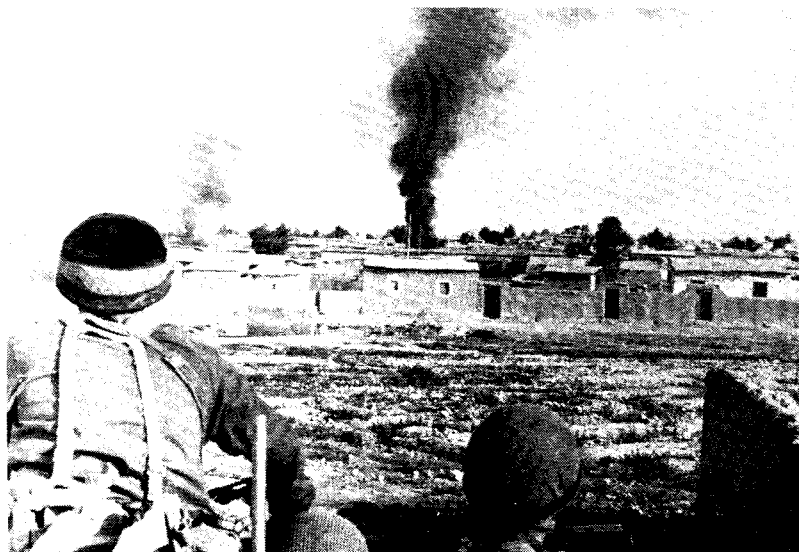
כוח צה"ל ליד העיירה כראמה בירדן

תושביה, לגרום להמרדת אוכלוסי השטחים נגד הנוכחות הישראלית ונגד מה שקרוי בפיהם "שלטון הכיבוש והדיכוי", לקיים בהתמדה מתיחות ולא להניח לרוחות באיזור להירגע. באותה עת חל שינוי דרגתי ביחסן של מדינות ערב אל ארגוני המחבלים ואל פעולותיהם נגד ישראל. ירדן וסוריה בעיקר החלו להעניק להם תמיכה מעשית בצידוד, באימונים ולעיתים אפילו, בעיקר בגבול ירדן, בחיפוי של ירי.